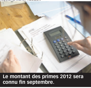
Le montant des primes 2012 sera connu fin septembre.

ASSURANCE-MALADIE Les pronostics des comparateurs: de +3% à +5,2% en 2012.