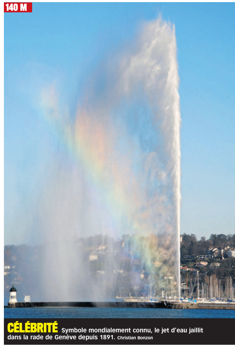
CÉLÉBRITÉ Symbole mondialement connu, le jet d'eau jaillit dans la rade de Genève depuis 1891. Christian Bonzon

Côté âge, pas de doute, avec ses 120 ans, le doyen genevois peut toiser des gamins plus grands mais créés dans les années 1980 à 2000. Avant d'être imité, le jet d'eau, lui, est né par hasard. En 1886, une usine hydraulique est installée à la Coulouvrenière. Le soir, il faut libérer la pression: on crée une vanne qui balance un chouette jet d'une trentaine de mètres dans les airs. Et si on en faisait une attraction touristique, se dit